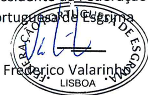
Frederico Valarinho LISBOA

O Presidente da Federação Portuguesa de Esgrima