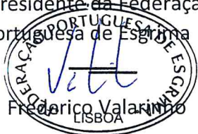
Frederico Valarinho LISBOA

O Presidente da Federação Portuguesa de Esgrima