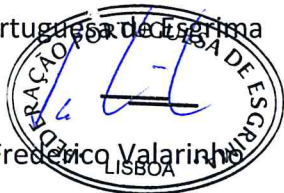
Frederico Valarinho LISBOA