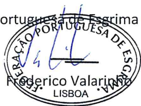
Frederico Valarinho LISBOA