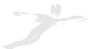
Pedro Melo Presidente da Mesa da Assembleia Geral